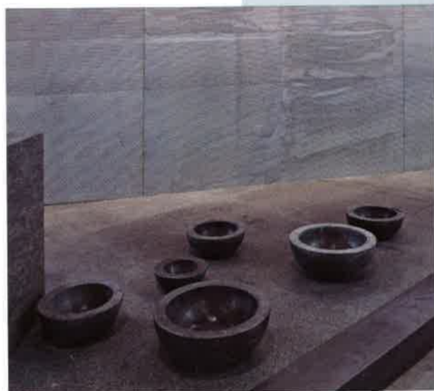
這是滿有層次的抽象建築空間，由於石面加上不同飾面，而呈現不同的顏色，Luca Scacchetti設計，Finstone S.A.R.L.製作。