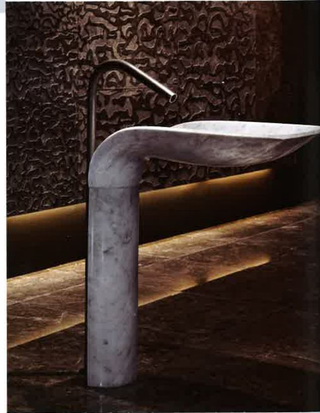
形態豐美的雲石洗面盆線條柔和，由Marco Piva設計，MGM Furnari製作。