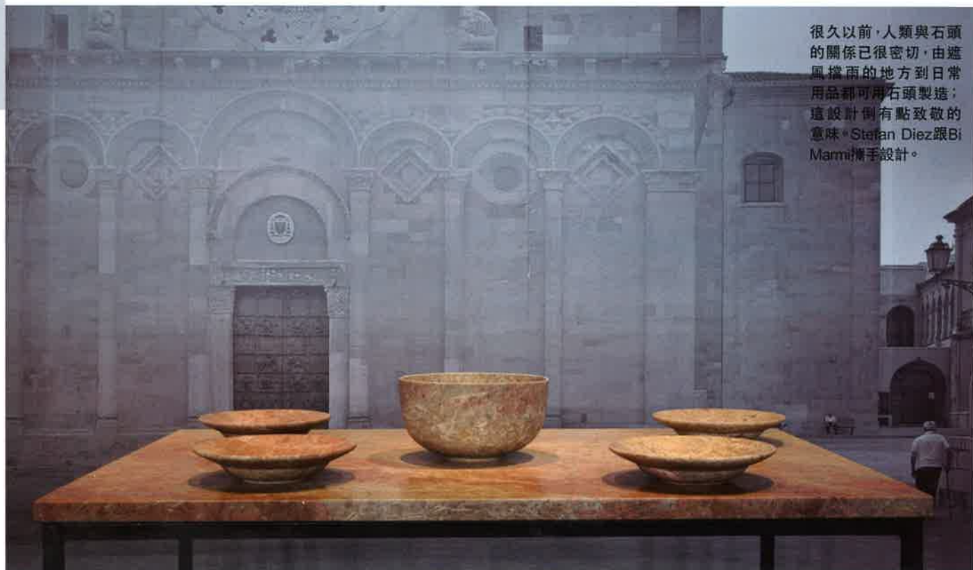
很久以前，人類與石頭的關係已很密切，由遮風擋雨的地方到日常用品都可用石頭製造；這設計倒有點致敬的意味。Stefan Diez跟Bi Mami攜手設計。