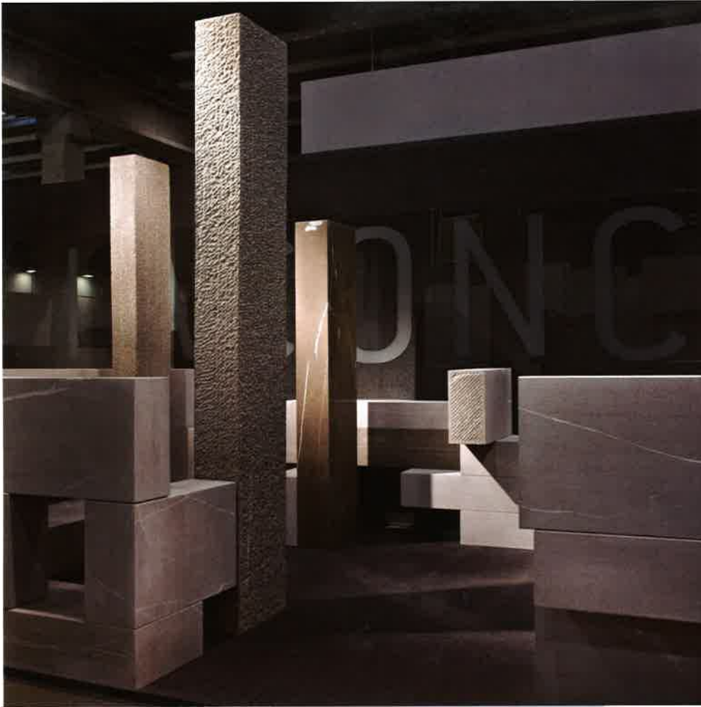
有如以方柱堆疊的名勝遺跡，同時融入未來感，Giovanni Vagnaz+Mod. Land設計，Iaconcig製作。