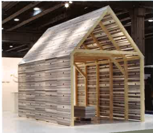
Thomas Sandell替Marsotto製作，用雲石和木料勾勒出具瑞典風格的渡假小屋。