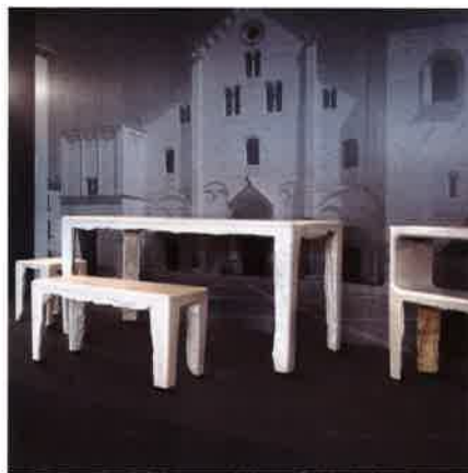
Rocaille系列包括一張桌子、長凳、書架，設計師Philippe Nigro期望在不斷改良下，令作品更細緻平滑；Petra出品。

屋」，憑著在結構上重複利用石材組件的做法，贏得評審委員會的嘉許；作品有效地表達這元素的特性本質。